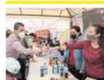
El alcalde Francisco Treviño anunció la Feria del Empleo.

700 vacancias fueron ofertadas en la Feria del Empleo.