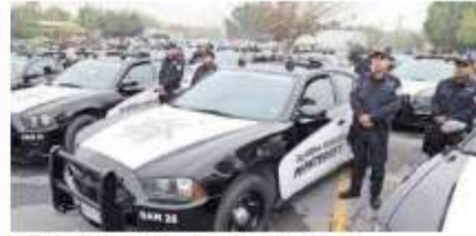
El alcalde dijo que fue un ordenamiento jurídico de un juez estatal.

“Son 100 elementos de Tránsito y Policía, es un tema que no depende de nosotros, es una orden directa” Luis Donaldo Colosio Alcalde de Monterrey