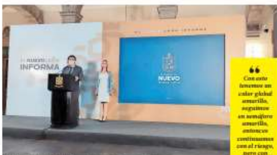
El Gobernador y la titular de la Secretaría de Salud del estado.

Así como los supermercados, farmacias, agencias, autobuses, salones de fiestas infantiles y centros deportivos.