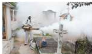
En las panteones se realizaron labores de limpieza y deshierbo.