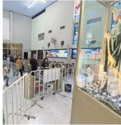
La celebración en San Judas Tadeo se realiza el 28 de octubre de cada año.